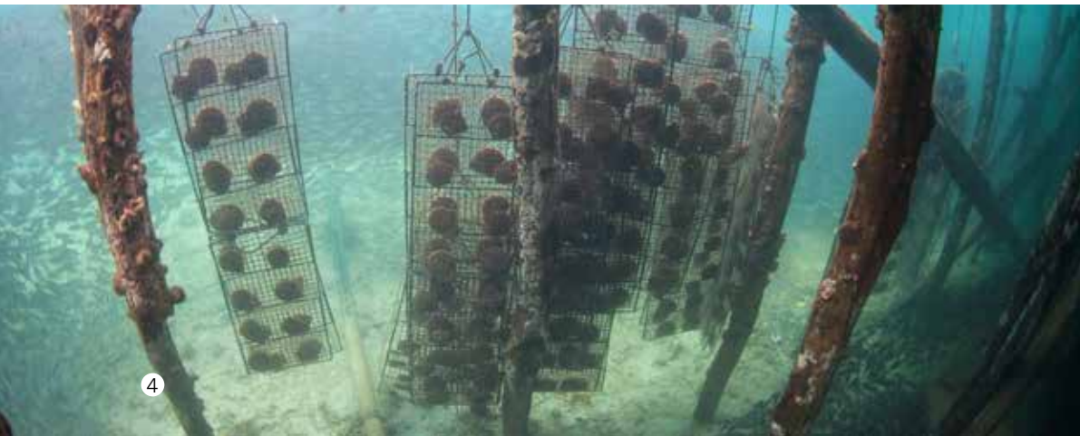
Granja de ostras

Hay muchas cosas que hacen que las perlas sean únicas y exóticas. El proceso por el cual se forman en la naturaleza y su papel a lo largo de los siglos, son solo dos ejemplos de estas cualidades. Las perlas son diferentes de todas las otras gemas porque son las únicas que provienen de una criatura viviente. Quizás esto es lo que les ha dado a las perlas un lugar tan apreciado, tanto en el pasado como en el presente.