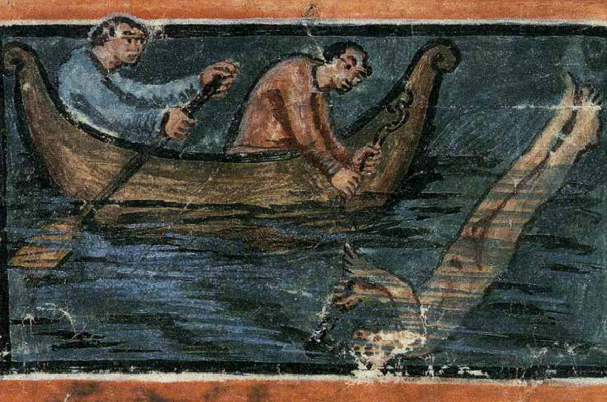
Pesca de perlas.

A lo largo de la historia, las perlas han sido codiciadas por su valor y consideradas un símbolo de riqueza. En 2300 a.C. se le entregaron perlas a la realeza china durante su visita a Roma. Los antiguos libros y leyendas sagradas de la India se refieren con frecuencia a las perlas, y de manera similar, se hace referencia a las perlas con reverencia en los textos musulmanes y cristianos.