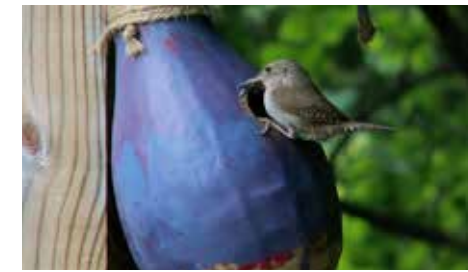
Guaje utilizado como comedero de pájaros.

Los guajes tienen muchísimos usos. Para los chinos, son objetos de buena suerte. En Perú y otros lugares de Sudamérica se cortaban de manera horizontal y baja para usarlos como vasos antes de la llegada de los españoles. Algunos viajeros europeos encontraron que en América usaban los guajes completos como flotadores para pasar los ríos. En América y África se han usado como instrumentos musicales de percusión haciéndoles pequeños cortes laterales. En diferentes regiones de México se utilizan como utensilios de cocina: pueden ser recipientes para tortillas, frutas o sal. Cada vez es más popular encontrarlos en los jardines como casa de pájaros o de insectos. En el sur de México se hacen monederos, alhajeros, y objetos decorativos con guajes pintados artísticamente.