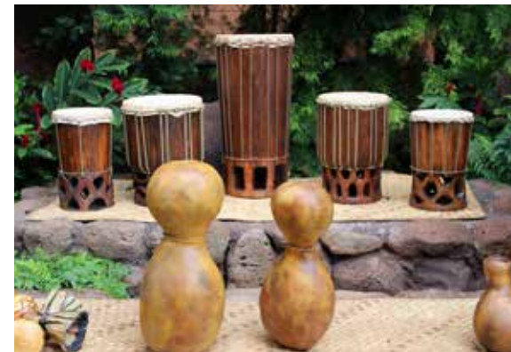
Instrumentos musicales elaborados con guajes.

Los guajes tienen muchísimos usos. Para los chinos, son objetos de buena suerte. En Perú y otros lugares de Sudamérica se cortaban de manera horizontal y baja para usarlos como vasos antes de la llegada de los españoles. Algunos viajeros europeos encontraron que en América usaban los guajes completos como flotadores para pasar los ríos. En América y África se han usado como instrumentos musicales de percusión haciéndoles pequeños cortes laterales. En diferentes regiones de México se utilizan como utensilios de cocina: pueden ser recipientes para tortillas, frutas o sal. Cada vez es más popular encontrarlos en los jardines como casa de pájaros o de insectos. En el sur de México se hacen monederos, alhajeros, y objetos decorativos con guajes pintados artísticamente.