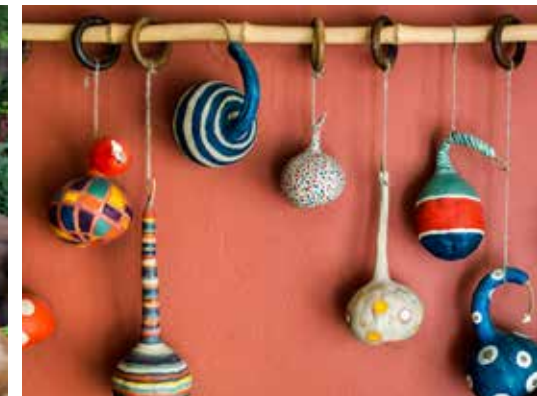
Arte y decoración hechos usando guajes.